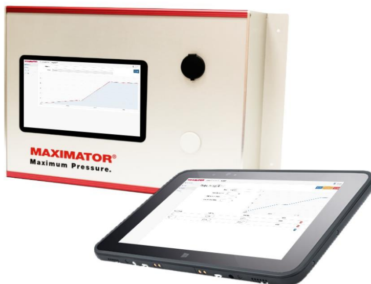
Рисунок 1. Внешний вид контроллера