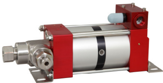
M111-2 (L) одностороннего действия, двойной поршень привода воздуха (Стандарт = Вход Снизу)